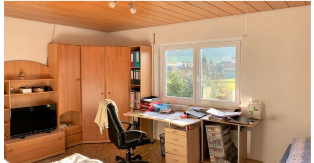
Kind I OG