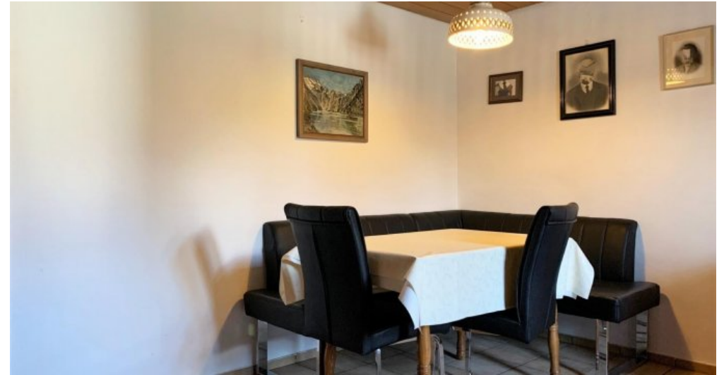
Essen I EG