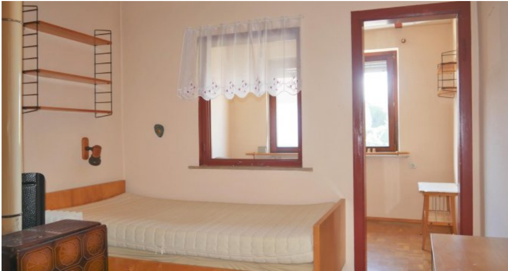
Kind 1 u 2 (OG)