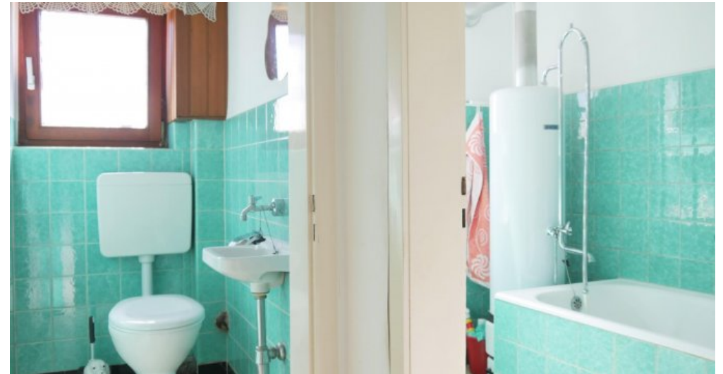
Bad und sep. WC (EG)