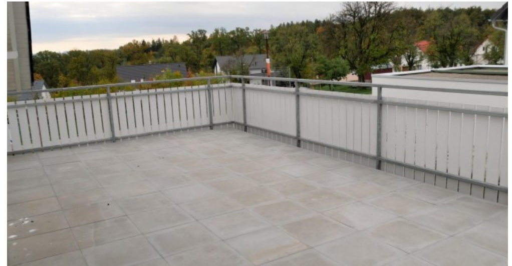
Großer Balkon (1. DG)