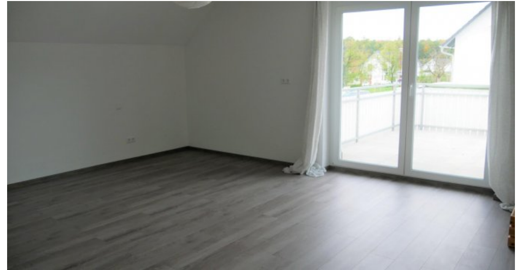
Kind I (1. DG)