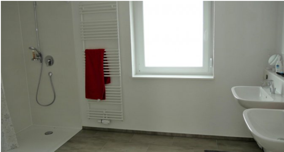
Großes Badezimmer (1. DG)