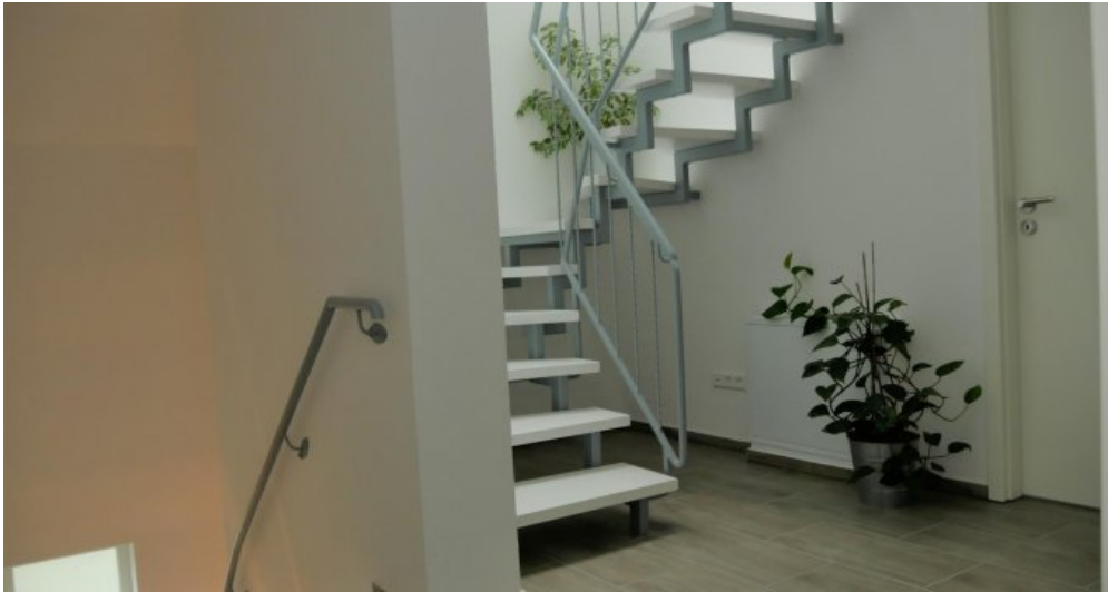
Flur 1. DG mit Treppe zu 2. DG