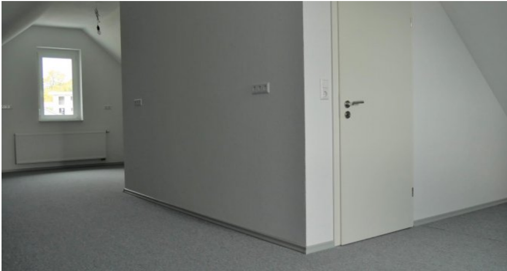
Ausgebautes Dachstudio (2. DG)