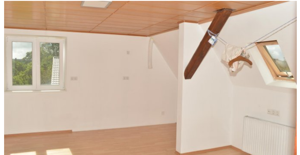
Zimmer 1. DG