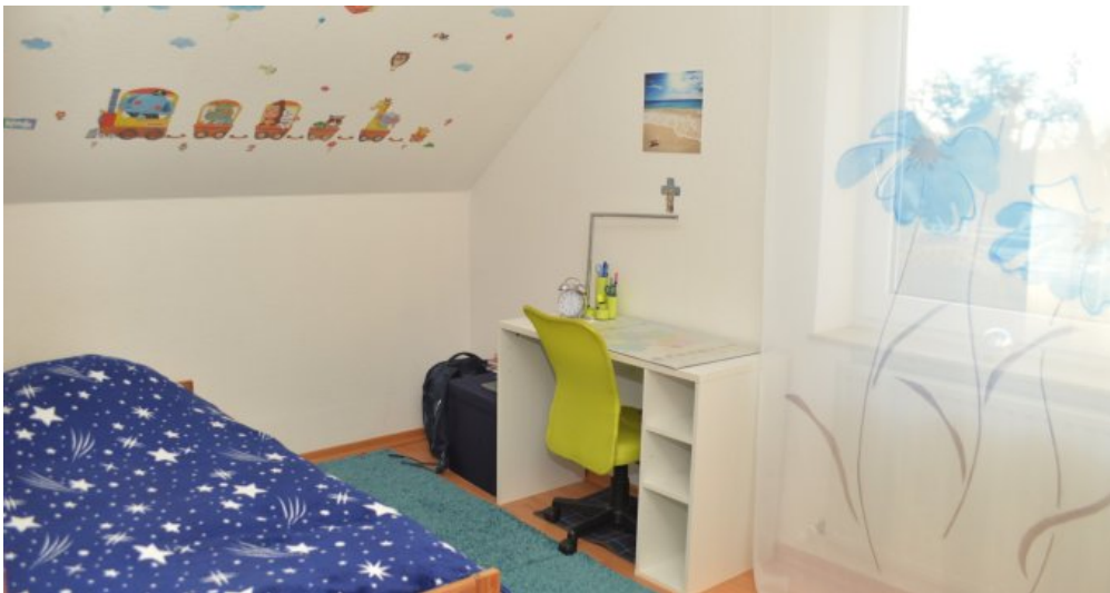
Kind II (DG)