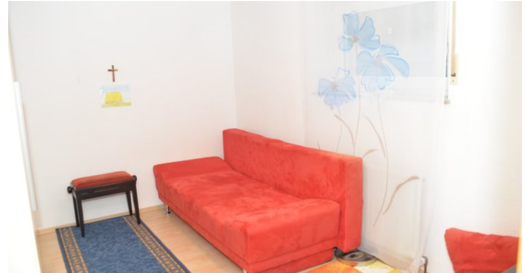
Zimmer I (UG)