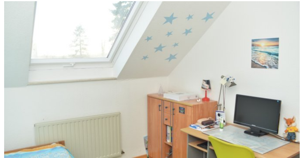
Kind I (DG)