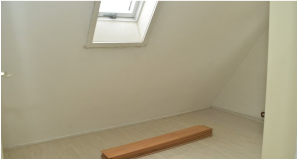
Zimmer 2 (DG)