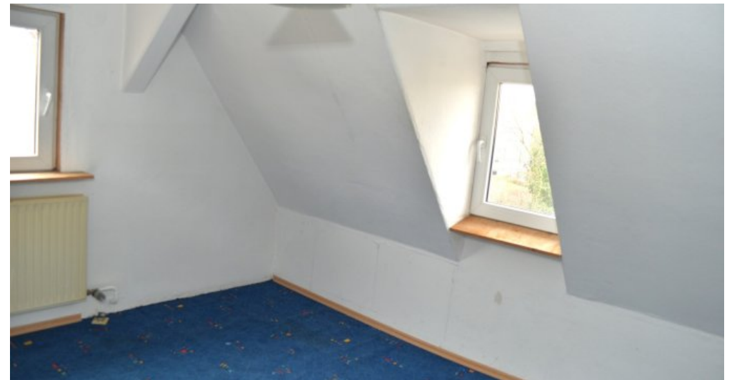
Zimmer 1 DG