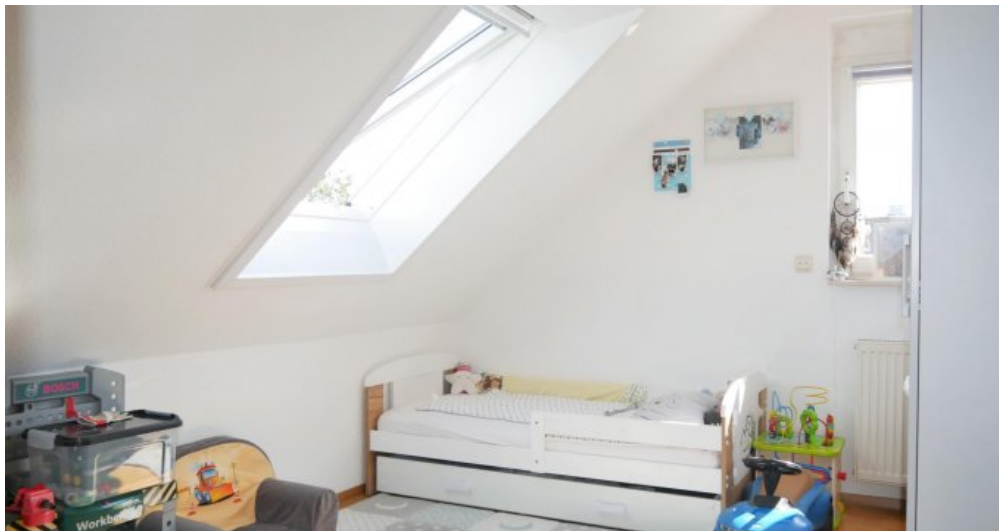
Kind I Galerie