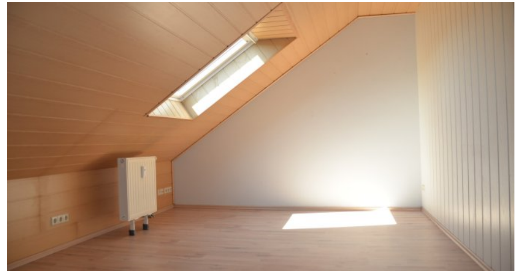
Zimmer 2 (II. DG)