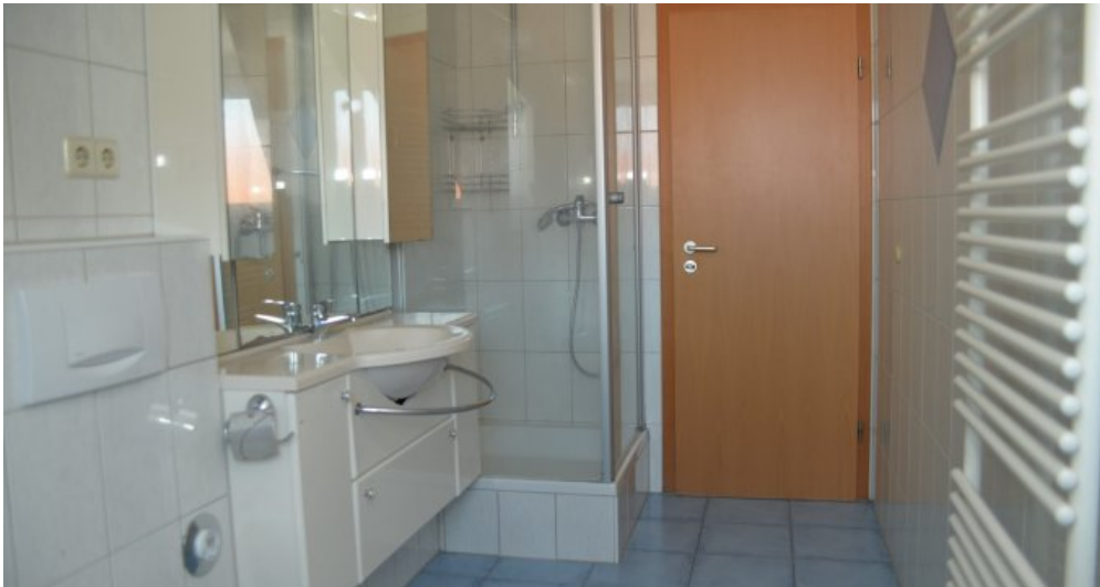
Bad I (I. DG)