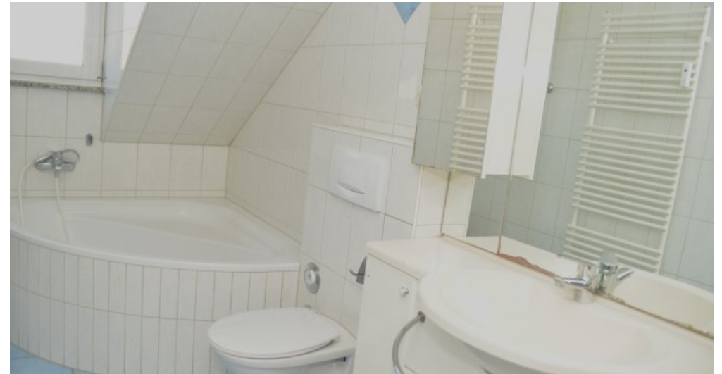
Bad II (I. DG)