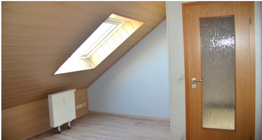
Zimmer 1 (II. DG)