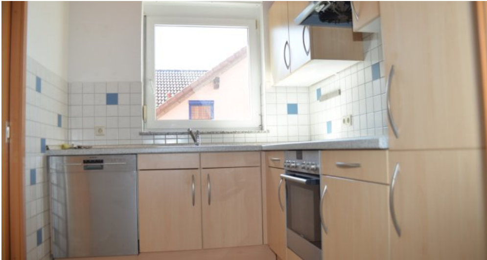
Küche I. DG